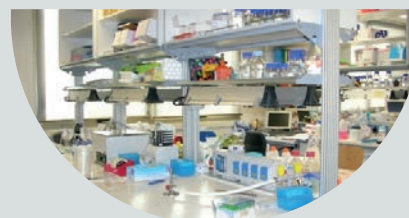
Il laboratorio didattico