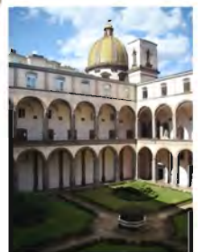
Complesso di San Pietro martire Via Porta di Massa, 1

La sede del Dipartimento è presso il Complesso di San Pietro Martire, in via Porta di Massa n. 1, dove si trovano gli Uffici della Area didattica, la Direzione, le aule e gli studi dei docenti afferenti alle Sezioni di Filologia moderna, Filosofia, Psicologia e Scienze dell'educazione, Scienze dell'antichità.