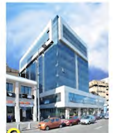
Edificio Iniziativa marina Via Nuova Marina, 33