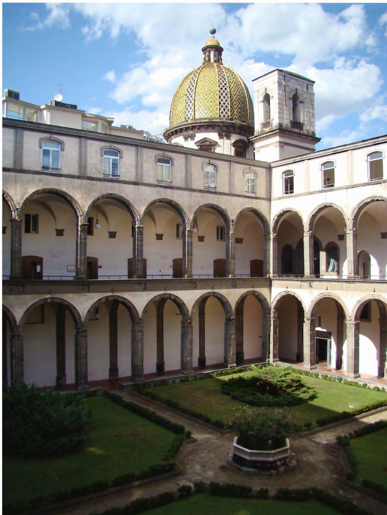
Complesso di San Pietro martire, Sede principale del Dipartimento di Studi Umanistici